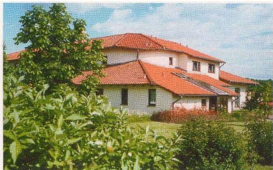
La Maison parentale

Ces opérations ont pour but: soutenir psychiquement parents, frères et soeurs et enfants malades et les aider matériellement dans des cas particuliers.